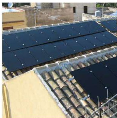
SU TETTO A FALDA