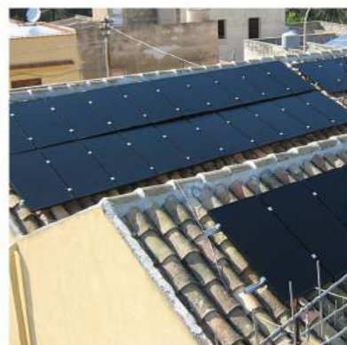
SU TETTO A FALDA