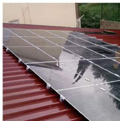
SU TETTO SPIOVENTE