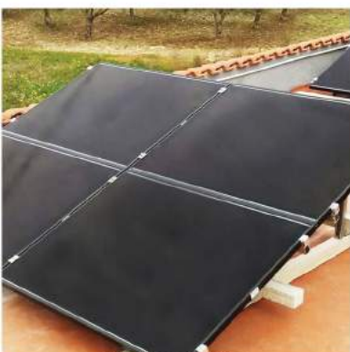
SU TETTO PIANO