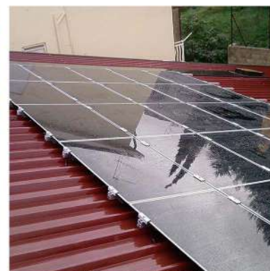
SU TETTO SPIOVENTE